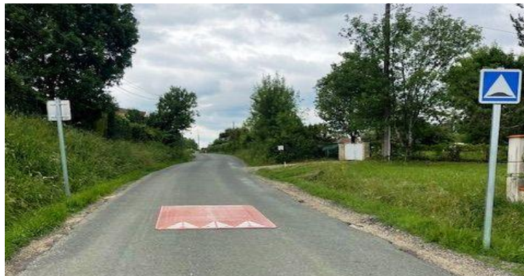
De gauche à droite : 2 buses bouchées, ralentisseur d'Hartanès. Ci-dessous à gauche : curage des fossés