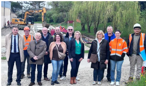
Photo ci-dessus : Réunion de travail avec M. le sous préfet du Lot-et-Garonne

Enfin, des vitres ont été installées à la place des anciennes portes bois à la salle polyvalente, permettant une meilleure isolation ainsi qu'un meilleur aspect architectural de ce bâtiment, bonifié par le remplacement du bardage bois.