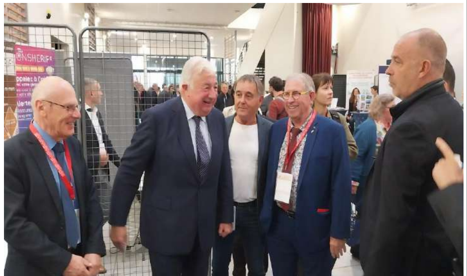
Photo : Le Maire avec le Président du Sénat lors du Congrès national des Maires Ruraux.

C'était l'occasion pour les maires ruraux de rappeler leurs priorités : valoriser la commune, conforter les élus dans leurs actions et préparer 2026.