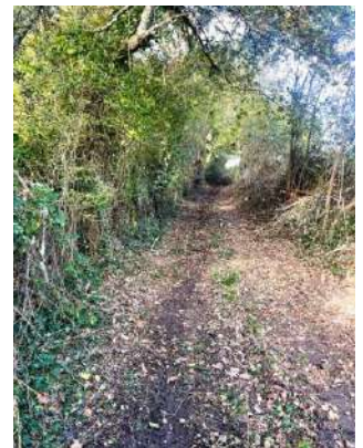
Photos 1 et 2 : Route de Moirax ; Photos 3 et 4 : Chemin d'Hartanès à Saint-Martin

Opération de collecte de sapins se déroulera sur notre commune du 1 er au 19 janvier , parking de l'école, broyage , le 21 janvier 2025.