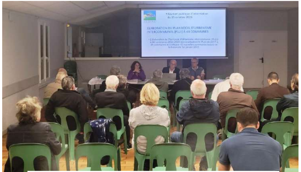
PLUiD : Réunion publique du 15 octobre 2024

Une réunion publique municipale s'est tenue le 15 octobre 2024 dans la salle des fêtes d'Aubiac, en présence d'une vingtaine d'aubiacaïs. Outre les six réunions publiques organisées par l'Agglomération d'Agen, cette réunion communale, organisée par la municipalité, avait pour but de bien présenter le diagnostic de territoire, l'impact de la loi climat et résilience sur le foncier à urbaniser sur les 44 communes de l'Agglomération et la position défendue par la municipalité d'Aubiac pour son zonage : volonté de garder les terrains constructibles au PLUi actuel, dans le diffus.