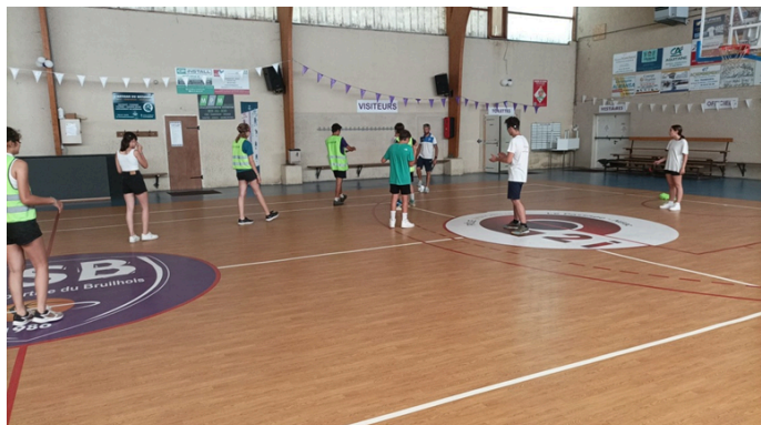
Sensibilisation au handicap par l'association handisport