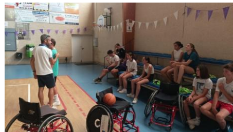
Sensibilisation au handicap