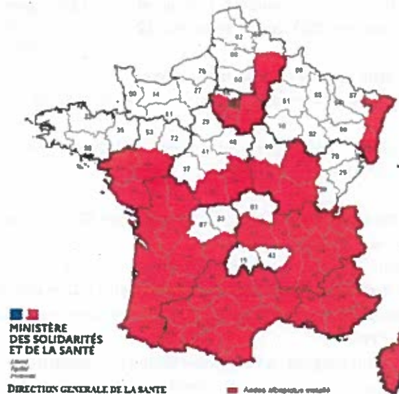
Carte des départements où l'installation d' Aedes albopictus est connue au 1er janvier 2020

Dans les départements en blanc (23 et -87), le moustique tigre n'est pas encore implanté, participez à sa surveillance !